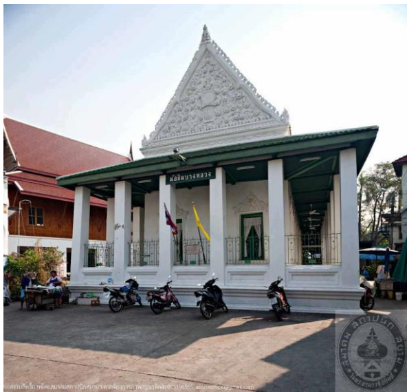
มัสยิดบางหลวง/ มัสยิดกุฎีขาว

รูปแบบสถาปัตยกรรม – การผสมกันระหว่างสถาปัตยกรรมไทย กับมัสยิด