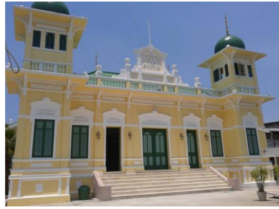
มัสยิดบางอ้อ

รูปแบบสถาปัตยกรรม – ชุมปะระตุ มัสยิดโดยทั่วไปมักมีการกำหนดขอบเขต สำหรับแยกพื้นที่ภายในที่สงบ ออกจากสิ่งรบกวนภายนอก โดยอาจสร้างกำแพง หรือคูน้ำ ล้อมรอบ เพื่อแยกเป็นสัดส่วน และมีชุมปะระตุเป็นตัวเชื่อมต่อที่บ่งบอกถึงการเข้ามาภายในมัสยิด ตลอดจนเป็นตัวเน้นมุมมองให้สัมพันธ์กับแกนกลางของมัสยิด ชุมปะระตุจึงมักเป็นส่วนที่มีการประดับตกแต่งอย่างงดงาม เช่นเดียวกับโดม และหอคอย หอคอยเป็นสถานที่สำหรับผู้ประกาศเวลาละหมาด หรือที่เรียกว่า มุอ์ซซิน ขึ้นไปอะซานให้ได้ยินไปไกลที่สุด การอะซานเป็นการเรียกให้มาละหมาด เมื่อถึงเวลาละหมาดประจำวัน วันละ ๕ เวลา เมื่อได้ยินเสียงอะซาน หรือการประกาศให้ทราบว่าจะเข้าสู่เวลาละหมาด ผู้ที่ได้ยินก็จะมาละหมาดร่วมกันที่มัสยิด พื้นที่ที่อยู่ในรัศมีเสียงอะซาน จึงมักเป็นข้อกำหนดขอบเขตพื้นที่ของชุมชน หอคอยมักสร้างเป็นหอสูงที่มีรูปทรงที่โดดเด่น และเป็นสัญลักษณ์ของมัสยิด ที่มองเห็นได้ในระยะไกล