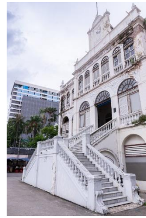
บริษัทอีสต์ เอเชียติก

รูปแบบสถาปัตยกรรม –อิทธิพลจากสถาปัตยกรรมฟื้นฟูเรอแนซ็องส์ของยุโรป ตัวอาคารทางเข้าหันหน้าเข้าหาแม่น้ำเจ้าพระยา โดยมีบันไดจากภายนอกเข้าสู่อาคาร ชั้น 2 บริเวณกึ่งกลางอาคาร มีการก่อ อิฐฉาบปูน 3 ชั้น ด้านบนเป็นดาดฟ้า การประดับตกแต่งอาคารค่อนข้างเรียบง่าย ไม่หรูหรา ฟุ่มเฟือย การทำบันไดทางขึ้นด้านหน้าลักษณะนี้เป็นรูปแบบหนึ่งที่นิยมสร้างในสมัยรัชกาลที่ 4 อาคารอีสต์ เอเชียติก หรือ ตึกเก่า บริษัทอีสต์ เอเชียติก เป็นอาคารอนุรักษ์ที่เคยเป็นอดีตที่ทำการของบริษัทค้าไม้ ดีอีสต์ เอเชียติก คอมพานี (The East Asiatic Company: EAC) ประจำกรุงเทพมหานคร อาคารได้รับการออกแบบโดยอันนิบาเล รีกอตตี (Annibale Rigotti) และก่อสร้างตามแบบสถาปัตยกรรมฟื้นฟูเรอแนซ็องส์ในช่วงปี พ.ศ. 2434 อาคารตั้งอยู่ในซอยเจริญกรุง 40 (ซอยโรงเรียนอัสสัมชัญ) ติดกับท่าเรือโอเรียนเต็ล ตรงข้ามกับโรงแรมแมนดารินโอเรียนเต็ล แขวงบางรัก เขตบางรัก กรุงเทพมหานครรูปแบบของอาคารได้รับ