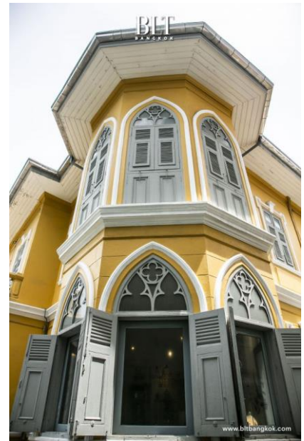
บ้านอาจารย์ฝรั่ง (อ.ศิลป์ พีระศรี)

รูปแบบสถาปัตยกรรม – อาคารโครงสร้างผนังรับน้ำหนัก (Wall Baring) รูปแบบกลิ่นอายแบบ Gothic หอยอดแหลม 8 เหลี่ยม ชุ่มหน้าต่างต่างแบบโค้งยอดแหลม (Pointed Arch) มีระเบียงยื่นจกตัวอาคาร ในทิศใต้และทิศตะวันตก เพื่อเพิ่มร่มเงาให้อาคารในยามบ่าย