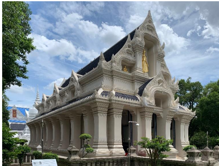
วัดราชาธิวาส

วัสดุ – ประดับผนังด้วยหินอ่อน ซึ่งเป็นหินอ่อนจากอิตาลี ที่ใช้ในการสร้างพระที่นั่งอนันตสมาคม