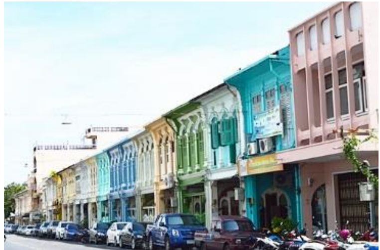
อาคารพาณิชย์ จ.ภูเก็ต

รูปแบบสถาปัตยกรรม - ตึกแถวก่ออิฐหรือคอนกรีตที่สร้างขึ้นมาเป็นแนวยาวติด ๆ กัน แล้วแบ่งเป็นบล็อก ๆ มีหน้าตึกกว้างประมาณไม่เกิน 5 เมตร และข้างในทำเป็นแนวยาวลึกเข้าไป ช่วงหน้าตึกบางตึกมีเฉลียงยื่นออกมา ที่ประตูและหน้าต่างกรุกระจกพร้อมกับตกแต่งลวดลายที่ชอบ ใช้พื้นกระเบื้องดินเผาปูพื้นและหลังคามุงกระเบื้อง