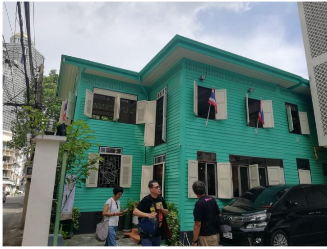
บ้านเขียว บ้านอิสลาม ถ.เจริญกรุง