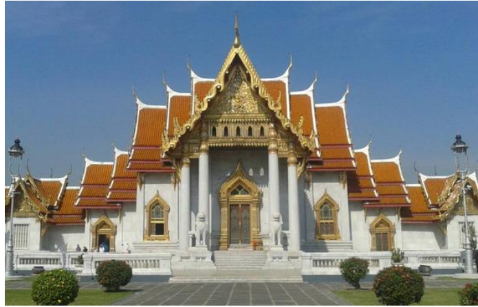
วัดเบญจมบพิตร