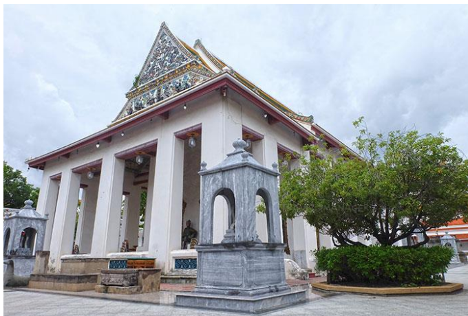
วัดราชโอรสาราม

รูปแบบสถาปัตยกรรม – สถาปัตยกรรมกระบวนจีน เอกลักษณะหลังคาประดับเครื่องเคลือบ และซุ้มประตูจีน พระอุโบสถเครื่องก่อ เสาเหลี่ยมเรียบ ล้อมรอบ ไม่มีประดับหัวเสา พื้นที่ระเบียงล้อมรอบ เกิดเป็นพื้นที่ semi outdoor หรือ พื้นที่เปลี่ยนผ่าน(Transitional space) ก่อนเข้าสู่พื้นที่ปิด ภายใน หน้าบันประดับเครื่องเคลือบ ไม่ประดับช่อฟ้า ใบระกา ทางหงส์