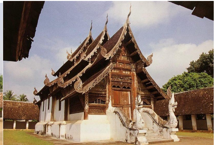
วัดต้นเกว๋น

รูปแบบสถาปัตยกรรม – ศิลปะล้านนา (ระหว่างสิบคั่น)