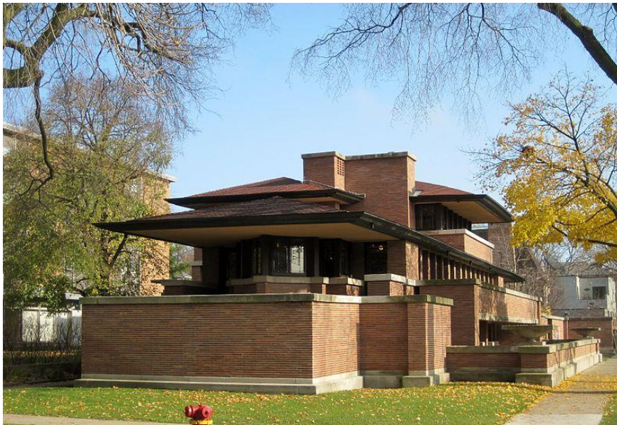
ภาพ 10.2 Frank Lloyd Wright Robie House

รูปแบบหลังสมัยใหม่ (Post Modern) ก็มักจะมีการใช้สีเส้นที่สดใส หรือวัสดุที่แปลกใหม่ ตลอดจนรูปทรงที่แปลกตา เข้ามาใช้ในงานด้วยเช่นกัน โดยเฉพาะอาคาร สถาปัตยกรรม ทำให้เรา มักจะได้เห็น อาคารรูปทรงแปลกประหลาด หรือมีสีเส้น สดใสดัดกับอาคารสีเหลี่ยมทึบตันรอบข้าง โผล่มาอย่างน่าประทับใจ และยังสื่อถึงความหมายที่ซ่อนเร้นบางอย่างเอาไว้ในบ้างอาคาร