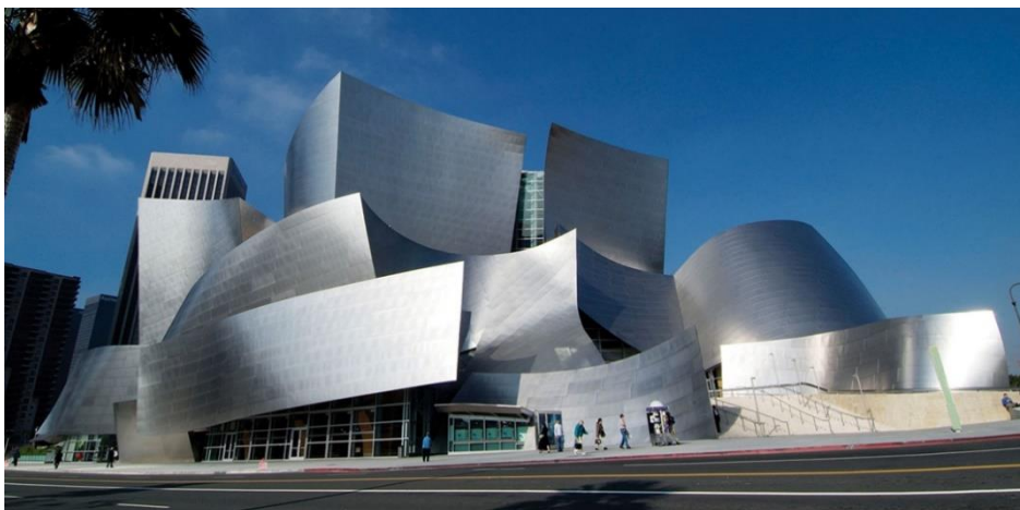
ภาพ 10.14 Frank Gehry: Guggenheim Museum Bilbao

10.3.4 พิพิธภัณฑ์กุกเกนไฮม์ (Guggenheim Museum) เป็นผลงานการออกแบบของ แฟรงก์ เกห์รี (Frank Gehry) สถาปนิกที่มีแนวความคิดงานแบบสถาปัตยกรรมหลังสมัยใหม่ (Post Modern Architecture) เกห์รี เป็นสถาปนิกสัญชาติแคนาดา-อเมริกัน มีความคิดในการทำงานแบบ หัวก้าวหน้า ได้มีงานออกแบบสำคัญๆ หลายชิ้นที่ทำให้งานแบบแนวคิดหลังสมัยใหม่นั้นได้รับความสนใจจากผู้คนมากมาย งานที่เค้าวางแบบจะเน้นการสื่อความหมายของรูปทรง และการสร้างรูปแบบที่มีความสลับซับซ้อน เกินคาดถึง ด้วยความสลับซับซ้อนและหลุดโลกของเค้าทำให้งานที่ออกแบบแต่ละชิ้นนั้นได้รับความสนใจเป็นอย่างมาก ตัวอย่างงานที่น่าสนใจที่สำคัญก็คือ พิพิธภัณฑ์กุกเกนไฮม์ (ภาพ 10.13) ที่เกห์รีออกแบบไว้ที่เมืองบิวดา ประเทศสเปน เป็นอาคารพิพิธภัณฑ์ของเมือง การออกแบบรูปทรงที่มีความสลับซับซ้อน วัสดุภายนอกกรุด้วยหิน กระจกและไทเทเนียมซึ่งคุณสมบัติของวัสดุเหล่านี้เมื่อโดยแสงจากท้องฟ้าและผิวน้ำจะเกิดการเปลี่ยนแปลงและความเคลื่อนไหวตลอดเวลา พิพิธภัณฑ์กุกเกนไฮม์มีพื้นที่ใช้สอยประมาณ 24,000 ตารางเมตร เป็นพื้นที่สำหรับนิทรรศการ 11,000 ตารางเมตร ประกอบด้วย 20 แกลเลอรี มีหอประชุมกว่า 300 ที่นั่ง ร้านค้า ร้านหนังสือ และร้านอาหารระดับมิชลินสตาร์ นอกจากตัวอาคารแล้ว พื้นที่ด้านนอกอาคารก็เป็นสถานที่ในดวงใจของผู้ที่ชื่นชอบศิลปะ เพราะมีทั้งประติมากรรมกลางแจ้ง การเล่นดนตรีสด กีฬา และสนามเด็กเล่น งานออกแบบอาคารหลังนี้นั้นแทบจะคล้ายกับประติมากรรมมากกว่างานสถาปัตยกรรม ด้วยรูปทรงและการออกแบบนั้นต่างจากบริบทของพื้นที่โดยสิ้นเชิง แต่ผลของงานชิ้นนี้ทำให้อาคารหลังนี้นั้นเป็นที่รู้จักของผู้คนทั่วโลก