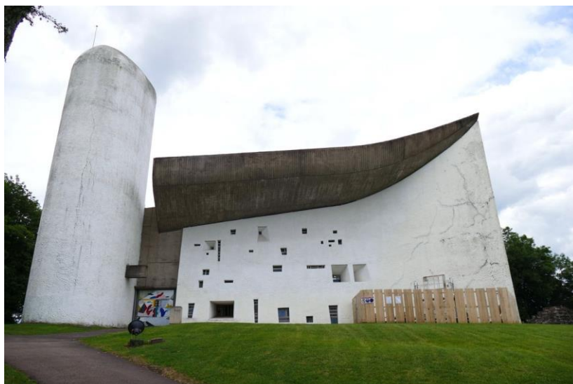
ภาพ 10.5 de Notre-Dame du Haut à Ronchamp

หมายเหตุ : from Le blog de jean-yves cordier. by jean-yves cordier dans. 2016. francebleu ( https://www.lavieb-aile.com/2016/08/la-chapelle-notre-dame-du-haut-a-ronchamp-le-corbusier-sculpteur-de-lumiere.html )