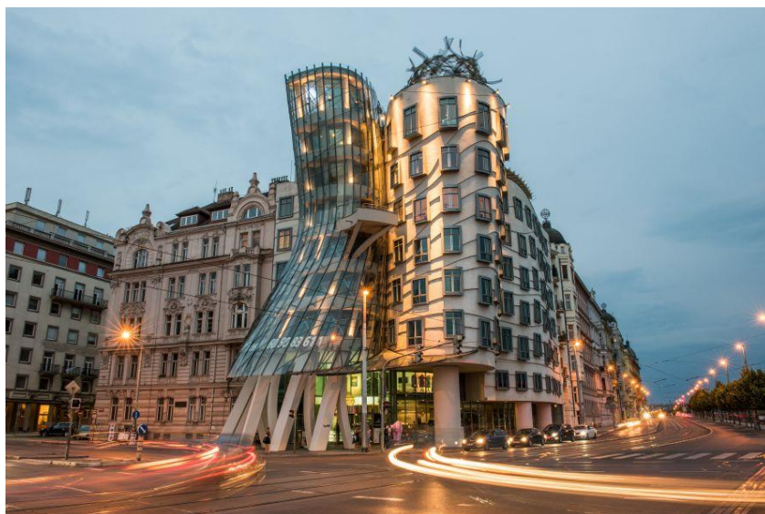
ภาพ 10.16 Dancing House

ของอาคารด้านบิดเบี้ยวเป็นโครงสร้างคอนกรีต (ภาพ 10.18) แสดงให้เห็นถึงความกล้าออกแบบที่แตกต่างไปจากบริบทอาคารโดยรอบซึ่งล้วนแล้วแต่เป็นอาคารทรงคลาสสิกแบบบาโรก (Baroque) หรือนีโอคลาสสิก (Neo-Classic)