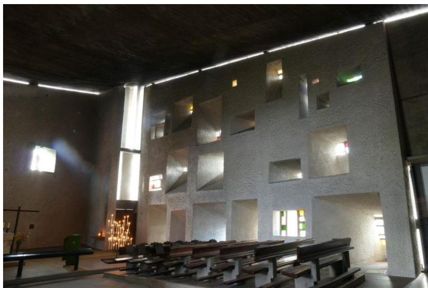
ภาพ 10.6 Chapelle Notre-Dame-du-Haut, Ronchamp