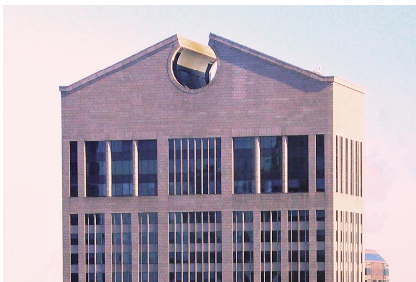
ภาพ 10.1 The Sony Building (formerly AT&T building)

ในปีคริสต์ศักราช 1966 โรเบิร์ต ชาร์ล เวนทูรี จูเนียร์ (Robert Charles Venturi, Jr.) ได้เขียนบทความตีพิมพ์เกี่ยวกับ "ความซับซ้อนและความขัดแย้งในสถาปัตยกรรม" เป็นตัวเร่งปฏิกิริยาสำหรับขบวนการหลังสมัยใหม่ เวนทูรีเป็นที่ถกเถียงกันอยู่ว่าเมืองโบราณของกรุงโรมพูดในชั้นประวัติศาสตร์และการตีข่าวที่มีชีวิตชีวามากกว่าเสียงเดียวกัน นอกจากนี้เขายังอ้างว่าอาคารเช่นเดียวกับการออกแบบวัตถุเป็นฝีมือของการวางและควรพยายามที่จะรองรับสภาพท้องถิ่นของพื้นที่ใกล้เคียงและพฤติกรรมสาธารณะ ในฐานะปัจเจกบุคคลและรวยพอยๆ กับตัวอาคารเอง