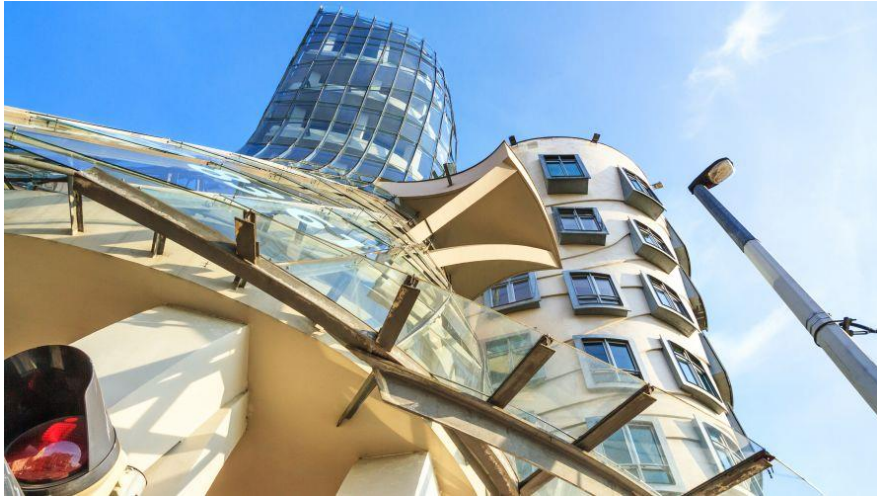
ภาพ 10.17 Dancing House

หมายเหตุ : from Dancing House สถาปัตยกรรมสมัยใหม่ กลางบรรยากาศเมืองเก่าปราง.