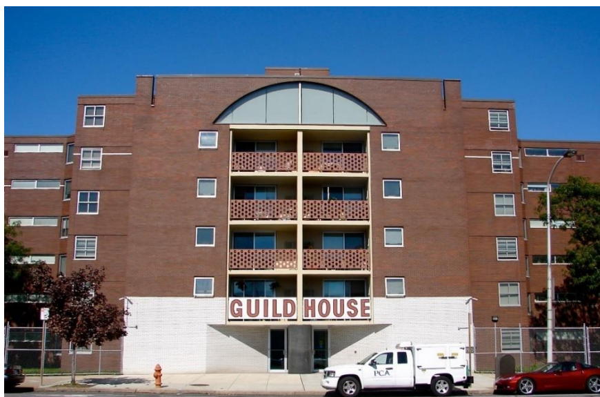
ภาพ 10.11 Guild House

10.3.2 กิลด์เฮาส์ (Guild House, 1960) (ภาพ 10.11) ออกแบบโดยสถาปนิกโรเบิร์ต เวนทูรี (Robert Venturi) เป็นอาคารที่อยู่อาศัยในฟิลาเดลเฟีย ประเทศสหรัฐอเมริกา ซึ่งเป็นงานสำคัญและทรงอิทธิพลของสถาปัตยกรรมสมัยศตวรรษที่ 20 และเป็นงานสำคัญชิ้นแรกของเวนทูรี ที่สร้างแนวความคิดการผสมผสานสัญลักษณ์ของรูปทรงคลาสสิกมาใช้ในรูปแบบใหม่ เส้นโค้งผสมกับเส้นเรขาคณิต ซุ้มทางเข้าด้านหน้าเคารพแนวถนนในฐานะผังเมืองของเมือง แม้ว่าตัวอาคารจะหุดเข้าด้านข้างทั้งสองข้าง ส่วนหน้าของอาคารนำเสนอแง่มุมที่ประหยัดด้วยอิฐแดงพร้อมหน้าต่างบานเลื่อนโลหะทั่วไป “วานนาเวนทูรีเฮ้าส์” (Vanna Venturi House, 1959) ถือเป็นผลงานที่สำคัญและมีอิทธิพลของสถาปัตยกรรมในศตวรรษที่ 20 และเป็นหนึ่งในการแสดงออกถึงสถาปัตยกรรมหลังสมัยใหม่เป็นครั้งแรกแสดงถึงการปฏิเสธอุดมคติสมัยใหม่อย่างมีสติและถูกอ้างถึงอย่างกว้างขวางในการพัฒนาต่อไปของขบวนการหลังสมัยใหม่ ในการออกแบบ ยังมีการแทรกเรื่องการสะท้อนถึงวัฒนธรรมของชาวอเมริกาที่ยึดติดกับสื่อโทรทัศน์ ด้วยการออกแบบให้มีเสาโทรทัศน์ขนาดใหญ่ไว้บนหลังคาอาคาร ทางเข้าอาคารมีการออกแบบเสากลมตรงกลางทางเข้า ใช่องแสงอาร์คขนาดใหญ่ในชั้นบนสุดที่ต่างจากชั้นอื่น เพื่อแสดงให้เห็นถึงบริเวณพักผ่อนรวมของผู้อยู่อาศัยที่จะมานั่งดูโทรทัศน์ร่วมกัน อาคารหลังนี้แสดงให้เห็นถึงการสื่อสารเรื่องราวงานสถาปัตยกรรม