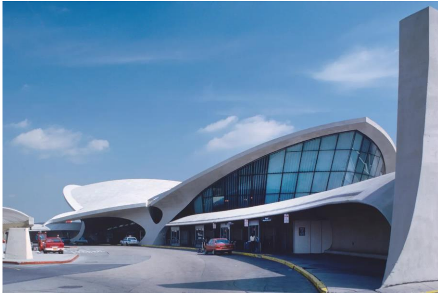
ภาพ 10.7 The flight tubes that connect the historic TWA Terminal to JFK Airport หมายเหตุ : from Preserving an icon. by Sarah Firshein . 2019. ny.curbed ( https://ny.curbed.com/2019/7/23/20696897/twa-hotel-jfk-airport-new-york-history-preservation )