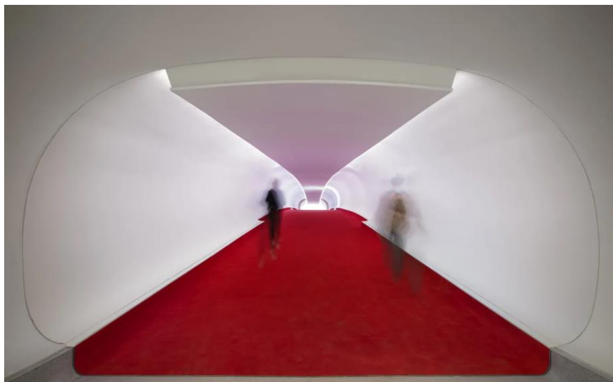
ภาพ 10.8 The flight tubes that connect the historic TWA Terminal to JFK Airport