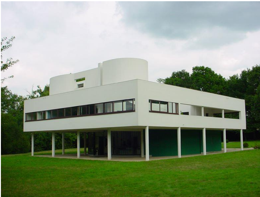
ภาพ 10.3 Villa Savoye

อาคารหลังนี้ภายนอกดูจะมีความเป็นอาคารทรงสี่เหลี่ยม ตั้งอยู่บนเสาสูงขนาดเล็ก ได้ถุนสูง หน้าต่างเปิดช่องยาวตลอดแนวเมื่ออยู่ภายในจะมองออกมาภายนอกได้อย่างอิสระการเชื่อมต่อของแต่ละชั้นด้วยบันไดเวียนขนาดเล็ก เป็นกรตอบสนองแนวคิดการออกแบบงานสถาปัตยกรรมสมัยใหม่อย่างแท้จริง จะเห็นงานนี้ แสดงถึงรูปลักษณ์ที่เรียบง่าย ไม่มีที่ประดับประดาส่วนรายละเอียดที่เกิดความจำเป็น แสดงถึงการออกแบบพื้นที่ใช้สอย สู่รูปแบบอาคารภายนอกอย่างตรงไปตรงมา โดยถ้ามองอย่างแนวความคิดใหม่นั้น อาจจะมีมองภาพ อาคารหลังนี้นั้นเรียบง่ายไม่มีความน่าสนใจของรายละเอียด การสื่อความหมายใดๆ ที่จะทำให้ผู้ที่พบเห็นรู้สึกถึง การสร้างสัญลักษณ์อะไร หรือการมองอาคารอย่างการตั้งข้อสังเกตแต่อย่างใด กลับมองว่ารูปแบบอาคารนั้นตรงไปตรงมา ไม่ต้องมีการตีความหรือการอธิบายอะไรมากมายนั้น ในทางแนวคิดแบบสถาปัตยกรรมหลังสมัยใหม่อาจมองว่า รูปแบบมีแข็งทื่อ ไม่มีความน่าสนใจ และไม่เกิดความสนุกสนานหรือความประทับใจตามแนวคิดหลังสมัยใหม่