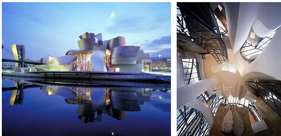
ภาพ 10.15 Frank Gehry: Guggenheim Museum Bilbao

หมายเหตุ : from Frank Gehry. by The Editors of Encyclopædia Britannica. 2019. britannica ( https://www.britannica.com/editor/The-Editors-of-Encyclopaedia-Britannica/4419 )